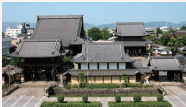
真宗興正派本山興正寺全景