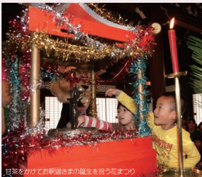
甘茶をかけてお釈迦さまの誕生を祝う花まつり