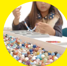
うでわ念珠づくり