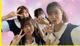
Glitter ☆Girls (アイドルサークル)