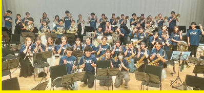
龍谷大学ウインドオーケストラ (ブラスバンド)