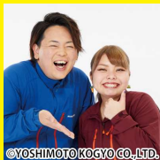
きや やろ つと きや やへ つと