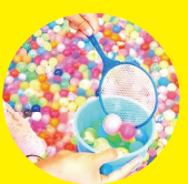
スーパ ーボ ール すく い