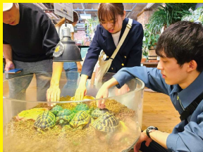
仏教青年会 (音楽バンド)